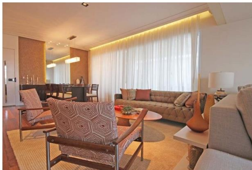
Use objetos de cores quentes e almofadas com tecido aveludado para um ambiente mais “quente”

O inverno pede cores mais quentes, com tons terrosos, e tecidos de toque aveludado. Pequenos vasos com tais cores, objetos de madeira e almofadas com essas texturas podem fazer a diferença.