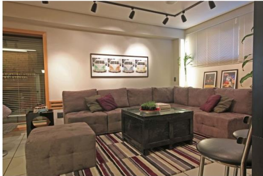
Tapetes felpudos combinam com a estação

Os modelos mais fofos combinam melhor com a estação porque, além de esquentar o local, são mais confortáveis para pisar, sentar e/ou brincar no chão da sala, por exemplo. Os de nylon são perfeitos para quem tem filhos, por conta da facilidade para limpar.