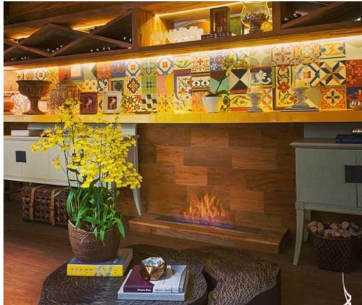
Lareiras portáteis são mais práticas para quem tem crianças

Mas não precisa ser uma de verdade, se você não tiver espaço (e disposição também!). Existem no mercado muitas opções que você usa como peça de decoração, e que funcionam com fluido a base de álcool. São bem práticas pois não precisam de lenha e exaustão. Perfeitas para aquecer o ambiente e deixá-lo mais agradável. Só não se esqueça de supervisionar os pequenos quando o aparelho estiver ligado, ok?