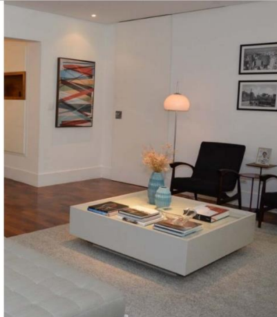
Prefira uma iluminação indireta, como luminárias de piso